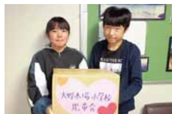
大野木場小学校 様