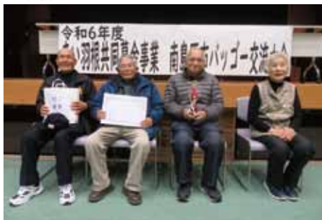
▲優勝したひまわり会(加津佐町)