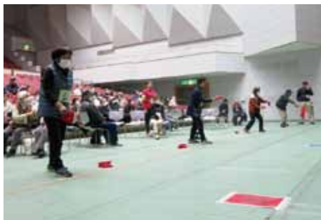
▲緊張の順位決定戦