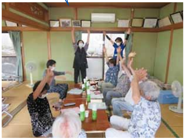
《花房生き生き会の皆さん》